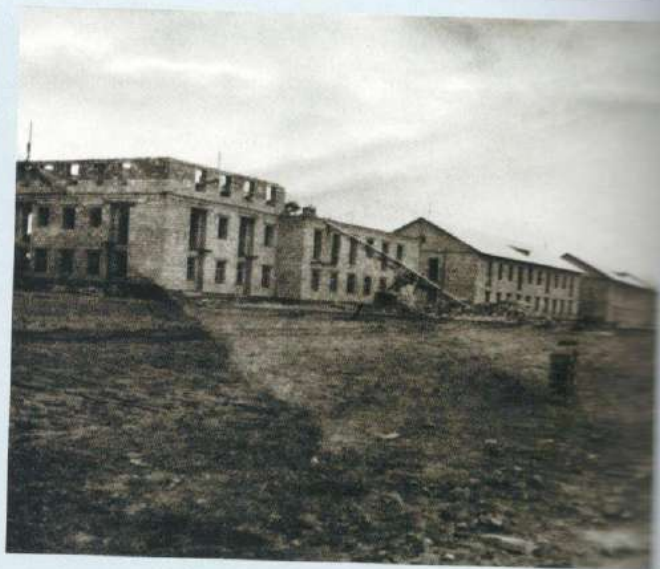
Первая линия двухэтажных домов вдоль Копейского шоссе. 1942 – 1943 гг.

В советские годы сквер КПЗиС был под школьным приглядом и заводским шефством. К сожалению, не сохранилось воспоминаний о том, какой жизнью жил сквер — скорее всего, пульсировал по соседству вслед за жизнью самого поселка, расцветиваясь от праздника к празднику. Вот только в новое пореформенное время