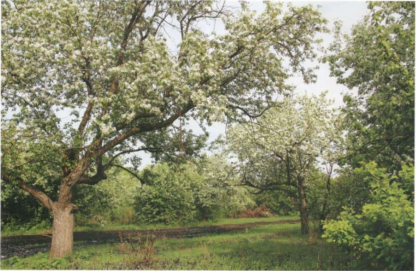
Весна. На Плодушке цветут яблони