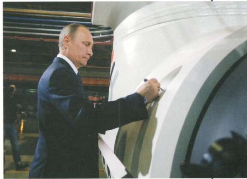
Президент Российской Федерации Владимир Путин 5 декабря на челябинском заводе «Этерно» дал старт производству новой продукции, не имеющей аналогов в стране. 2013 г.

Завод «Этерно» строился в той же логике и стилистике, что и «Высота-239», и отвечал принципам «белой металлургии». Но была одна важная особенность, неуловимая сторонним взглядом. Новый завод строился совместно с «Роснано» под современные технологии материалов. Настоящим шедевром инженерной мысли стало оснащение участков – для них было выбрано самое лучшее оборудование, которое на данный момент существует в мире. Лучшие гидравлические прессы пришли из Кореи, сварочные и листогибочные машины – из Швейцарии, нагревательные и закалочные печи – из Польши. Особенно постаралась Республика Беларусь, поставляя обрабатывающие центры под уникальную заводскую компоновку.